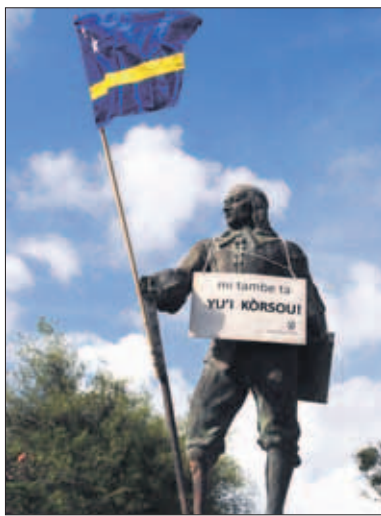
In 2010/2011 was een deel van de leerlingen van het Peter Stuyvesant College tegen de voorgestelde naamsverandering.

Gehring, Ch. en Schiltkamp, J. eds., Curaçao Papers 1640-1664, New York 1987. Gehring, Ch. ed., Correspondence 1647-1653, New Netherlands Documents Series vol XI, Syracuse 2000. Transatlantic Slave Database (www.slavevoyages.org). Emmer, P.C., De Nederlandse slavenhandel 1500-1850, Amsterdam 2000. Hartog, J., De geschiedenis van twee landen, Zaltbommel 1993. Page, W., The Dutch Triangle, The Netherlands and the Atlantic Slave Trade 1621-1664, New York 1997. Postma 1990: 'The Dutch in the Atlantic slave trade 1600-1815, Cambridge 1990.1